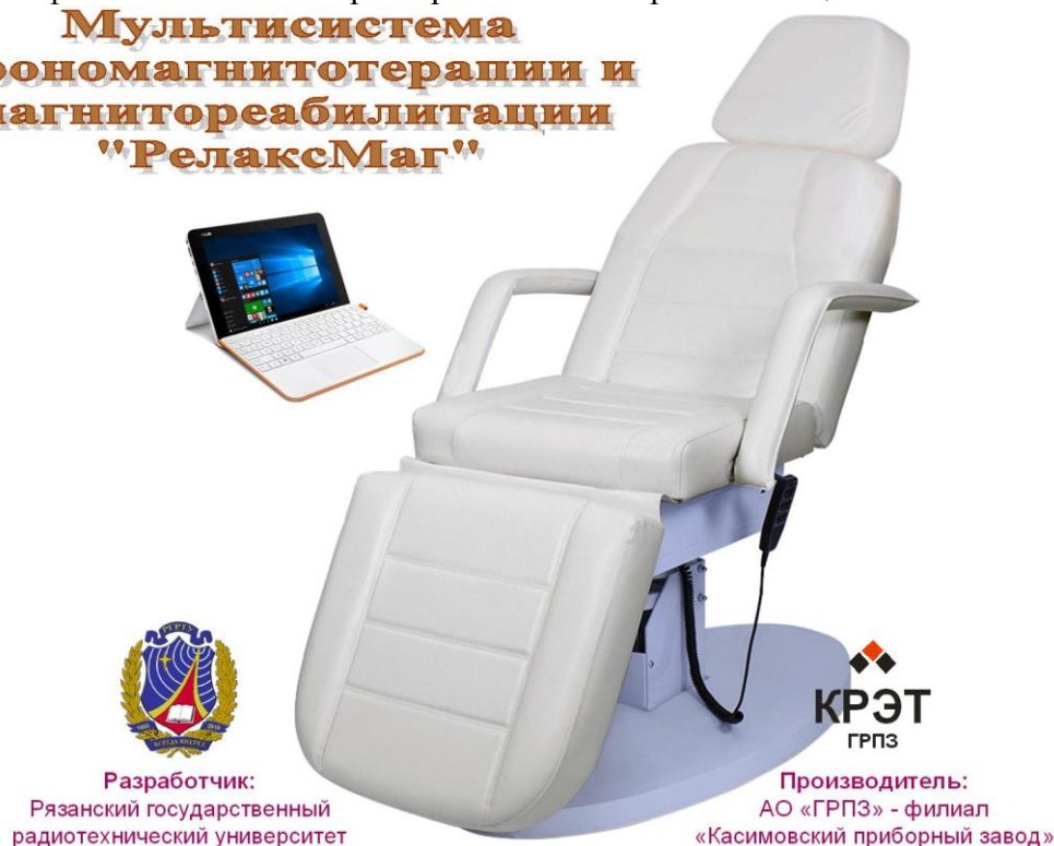
Рис. 1. Экспериментальный образец мультисистемы «РелаксМаг»

Система представляет собой совокупность функционально связанных аппаратно-программных средств на основе персонального компьютера (ПК) с программным обеспечением (ПО) для формирования и визуализации магнитного воздействия, а также регистрации и анализа биомедицинских сигналов.